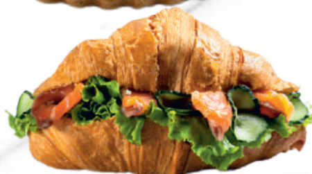
ВЕТЧИНА ҚОСЫЛҒАН КРУАССАН / КРУАССАН С ВЕТЧИНОЙ